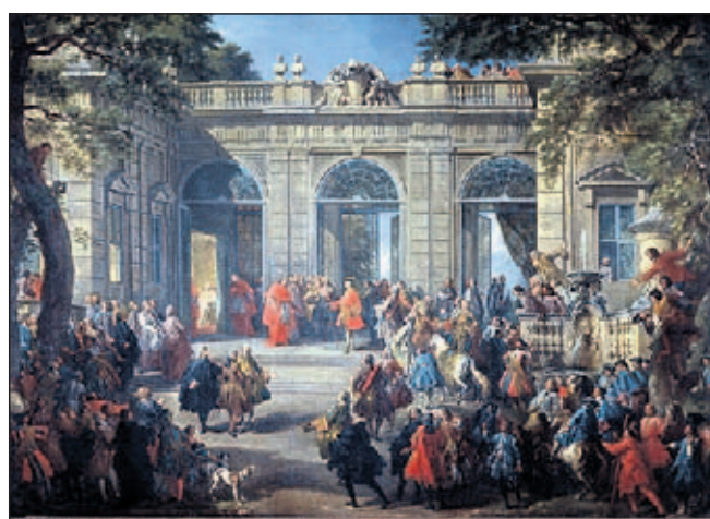
Accanto Carlo III di Borbone visita Benedetto XIV al Quirinale, di Giovanni Paolo Pannini. In basso Ritratto di Clemente VII (particolare) di Sebastiano del Piombo

icono culturale». Dalla Croce di Velletri del XII secolo, alla mitra e alla croce pettorale di Giovanni Paolo II; da Pisanello, Donatello e Beato Angelico, a Manzù (l'atesta di Giovanni XXIII) e a Pericle Fazzini (bozzetto della Resurrezione, in argento); palli e stole in seta, e i parati di Nicolò V; i ritratti dei nobili romani di Ferdinand Voet vicini al testamento di Cristina di Svezia, la regina convertita; il vecchio San Pietro, con accanto parte del nuovo; il reliquiario di Pio V Ghislieri attribuito a Benvenuto Cellini; l'autoritratto di Michelangelo che dipinge la Volta Sistina, e un sonetto autografo; il progetto di Bramante, non realizzato, per San Pietro. E' diminuito l'interesse dell'arte per i temi della religione; ma la Chiesa ne resta grande committente, e la Città Eterna eternamente meta di innumerevoli pellegrini.