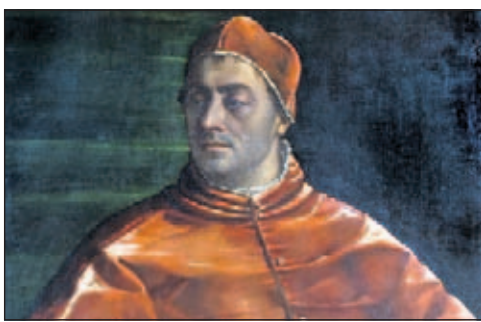
I papi della memoria a cura di: Mario Lolli Ghetti Castel Sant'Angelo da domani all'8 dicembre catalogo Gangemi