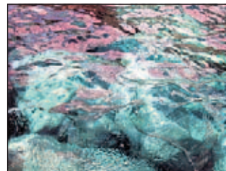
Filicudi di Gloria Satta

Nell'ambito del festival Pensieri e Parole all'Asinara, tornano in mostra le fotografie di Gloria Satta sui mari più belli del mondo