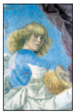
Melozzo da Forlì, Angelo che suona il liuto

Castel Sant'Angelo è stato il simbolo del loro potere temporale: in tempi remoti, la famiglia romana che ne otteneva il possesso spesso raggiungeva il papato; e sovente gli eredi di Pietro si sono salvati da incursioni e assedi